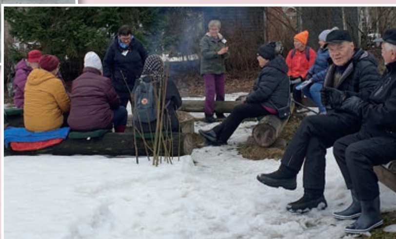
Nuotion äärellä vaihdettiin kuulumisia, paistettiin mak- karaa ja vaahtokarkkeja.