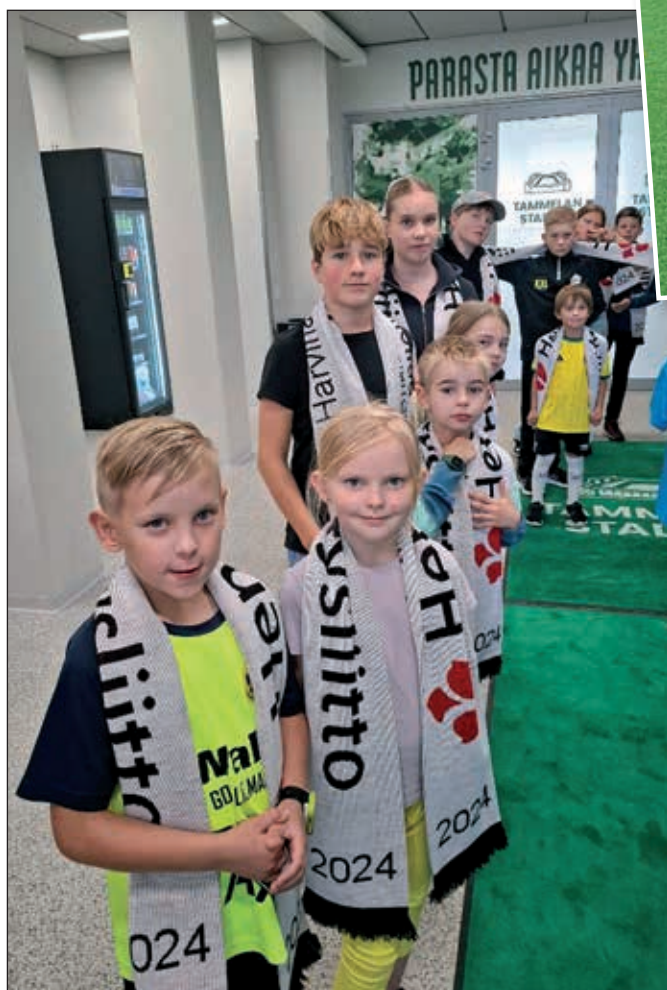
Hengitysliiton lapset ja nuoret pääsivät saattamaan Ilves-pelaajia.