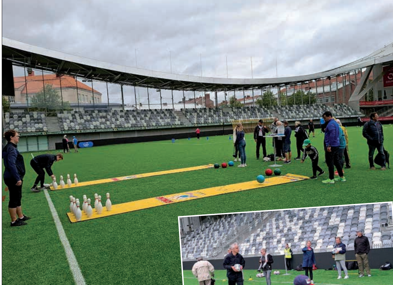
Monipuolista palloilua kentällä.