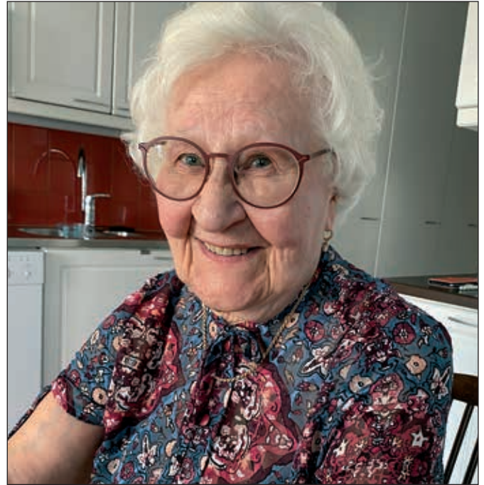
Lämminhenkinen juttutuokio Sinikan keittiössä kahvikupillisen ääressä kruunasi upean syyspäivän.

- Poikani ja lapsenlapset puolestaan saavat minut miettimään sitä, kuinka paljon elämässäni on hyvää. Haluan pitää kiinni ihmisistä ja asioista, jotka tuovat minulle onnea ja iloa!