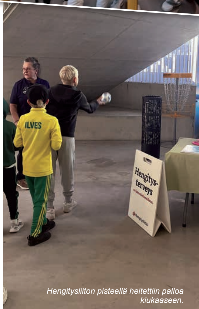
Hengityслиiton pisteellä heitettiin palloa kiukaaseen.