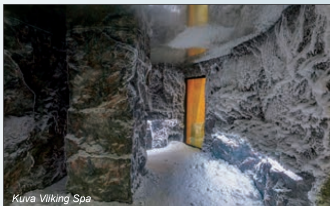
Kuva Viiking Spa

Illalla tutustuimme hotellin allasosastoon ja lukuisiin erilaisiin saunoihin: suomalainen sauna, kataja-sauna, suolas sauna, aromisauna, iglusauna hotellin kattotasanteella ja erikoisuutena vielä lumisauna. Lumisaunaan tuli mennä kuuman saunan jälkeen - ei suoraan altaasta - siellä piti olla tossut tai sandaalit jalassa ja maksimiaika saunassa sai olla vain 3-5 minuuttia. Tämän saunan hyödyllisiä vaikutuksia: rentoutuminen,