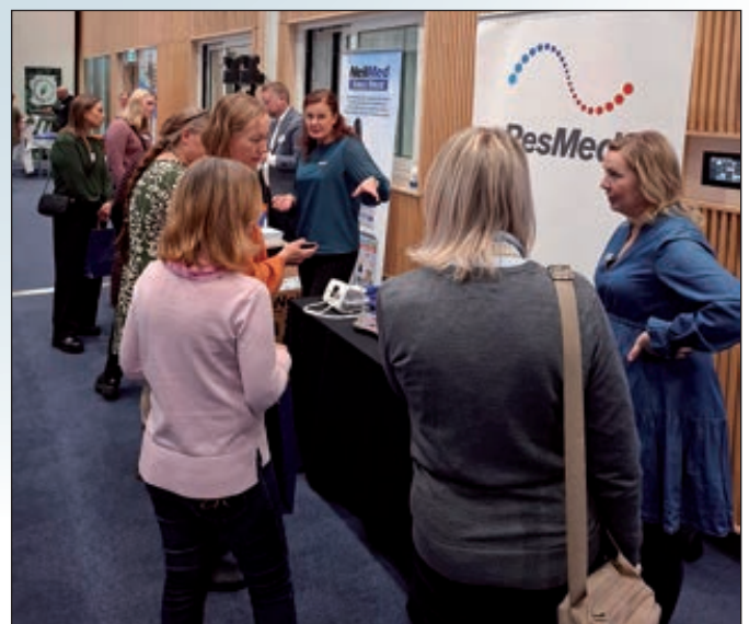
Uniapnea ja sen laitehoito kiinnosti kovasti ResMedin pisteellä.

teksti: Janne Haarala ja Veera Farin