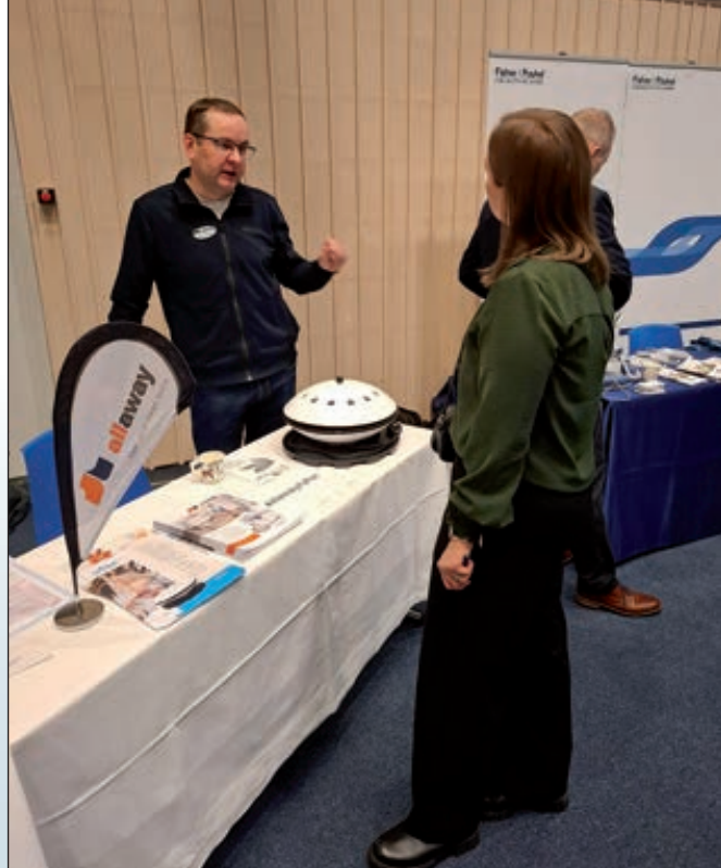
"Meilläkin on ollut tuollainen Ufo lapsuudenkodissa", oli monen koulutuspäivään osallistujan kommentti, kun he näkivät Ufox -ilmankostuttimen Allaway:n pisteellä.