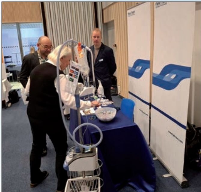
Fischer & Paykel Healthcaren pisteellä sai tutustua hengitystä helpottaviin laitteisiin.