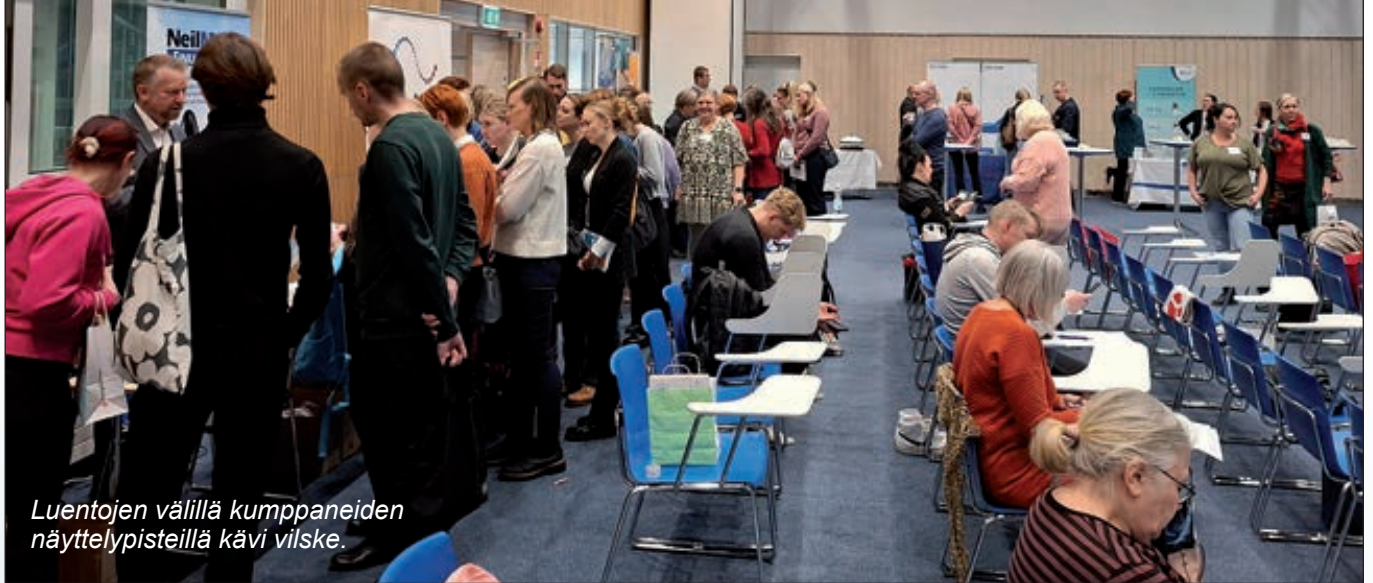
Luentojen välillä kumppaneiden näyttelypisteillä kävi vilskettä.